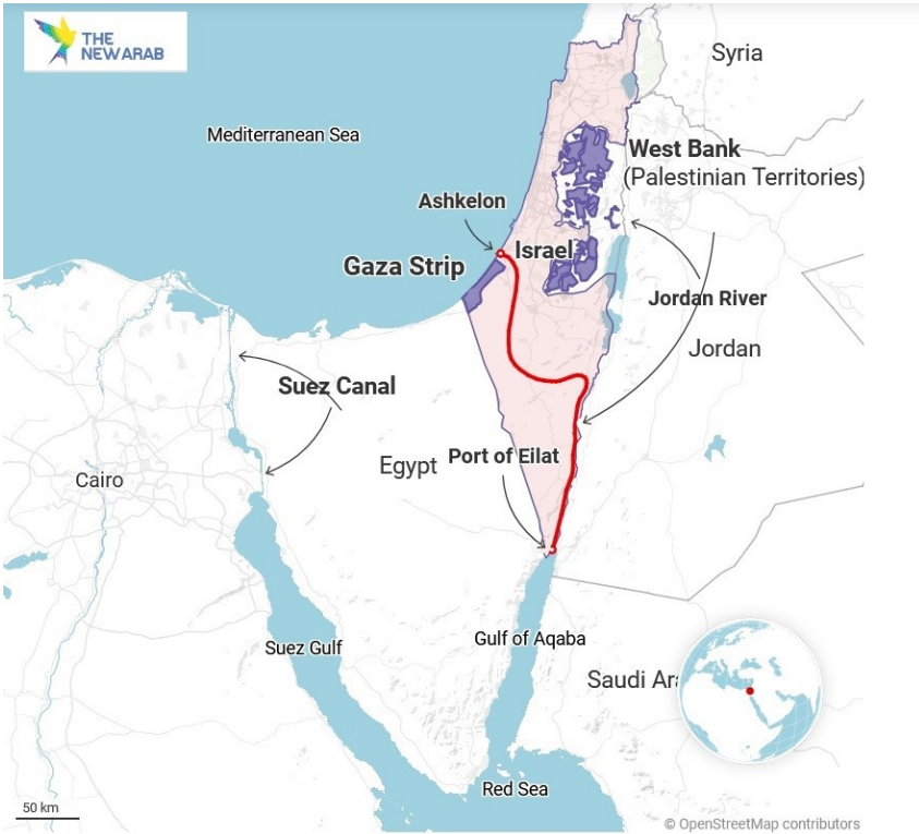
Il Canale Ben Gurion collegherebbe il Golfo di Aqaba (Eilat) nel Mar Rosso con il Mar Mediterraneo e passerebbe attraverso Israele per terminare nella Striscia di Gaza o nelle sue vicinanze (Ashkelon).

e chi dice il contrario è un "antisemita".